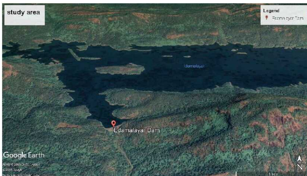
Map 1: Edamalayar Reservoir